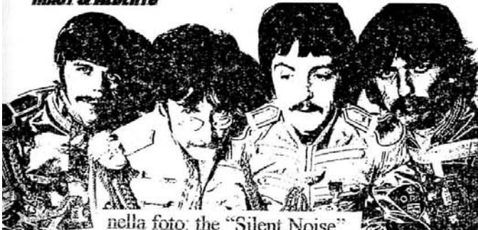
nella foto: the "Silent Noise"